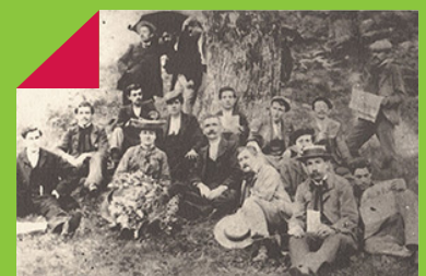
→ Séraphine Pajaud et le groupe Germinal de Saint-Junien (1903).

Séraphine Pajaud voit le jour en 1858 au Gillieux. Durant toute sa vie et à travers d'innombrables conférences données partout en France, elle n'aura de cesse de promouvoir les idées libertaires. Partie très tôt à Londres, elle y rencontre des exilés de la Commune de Paris venus outre-Manche pour échapper à la répression. C'est peut-être à leurs contacts qu'elle épouse les thèses de l'anarchie. Féministe, anticapitaliste, antimilitariste, anticléricale, anticolonialiste, syndicaliste : Séraphine Pajaud est de tous les combats ! Ses prises de positions révolutionnaires l'amènent à correspondre avec Louise Michel, mais lui valent aussi des ennuis judiciaires. Elle sera notamment condamnée pour « excitation au meurtre et au pillage » et pour « apologie de crime et insultes à l'armée » ! Séraphine Pajaud décède en 1944 dans l'Aveyron.